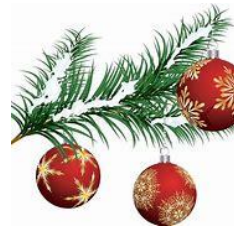
Weihnachtsbasar und Baum