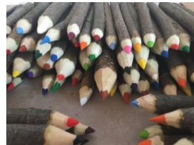
Bleistifte für die Schulanfänger