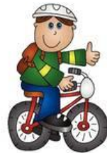
Bus zur Radfahrprüfung